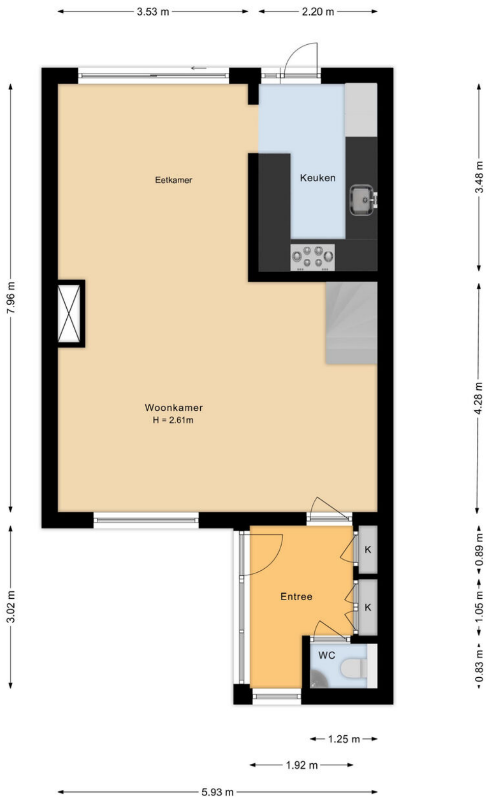
Coornhertdreef 24 Leiderdorp Begane grond