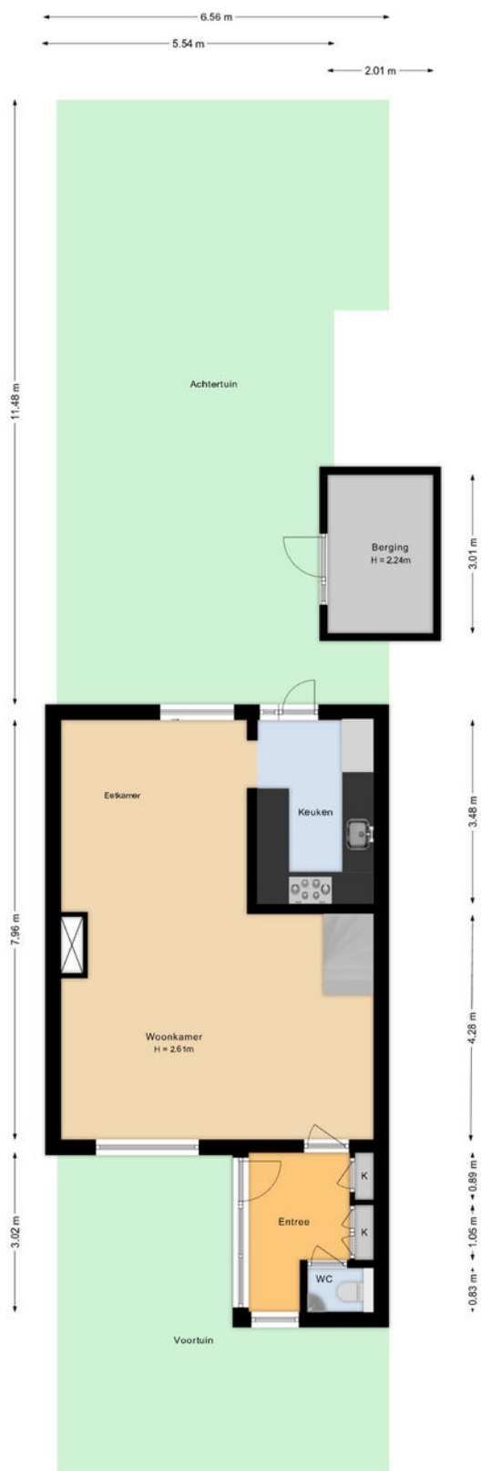
Coornhertdreef 24 Leiderdorp Situatie